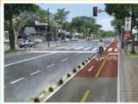
Ciclovias Américo Vespúcio