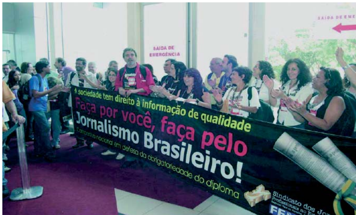
Jornalistas têm se mobilizado em caravanas a Brasília para tentar convencer os parlamentares a aprovar a PEC 386/09

conjuntas, e incentivar a adesão de todos cidadãos ao abaixo-assinado virtual que pede a imediata votação das nossas PECs, em http://www.peticaopublica.com.br